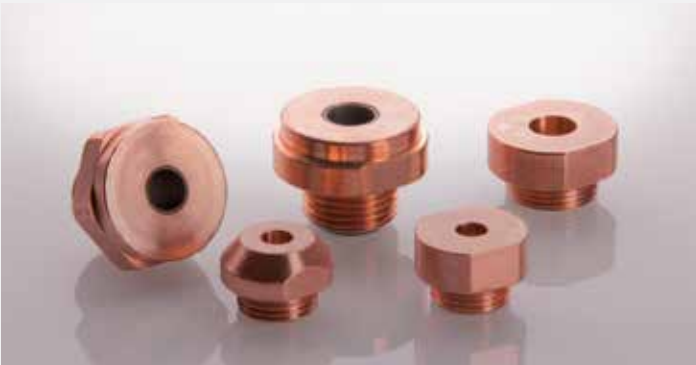
Electrodos para soldadura de proyección