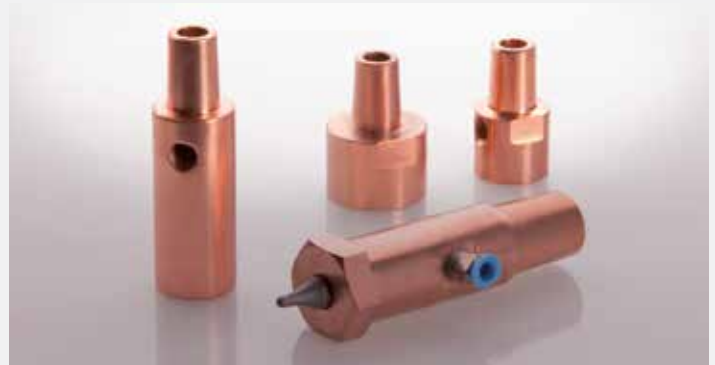
Porta electrodos para soldadura de proyección