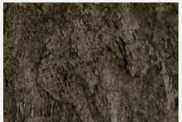
Estructura de grano fino de CuCrZr de Luvata

Luvata Ohio Inc. 1376 Pittsburgh Drive Delaware Ohio 43015 USA Tel: +1 740 363 1981