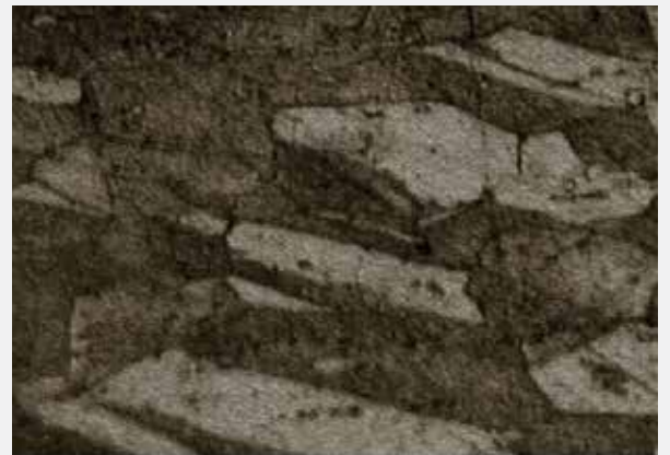
Estructura convencional de grano CuCrZr